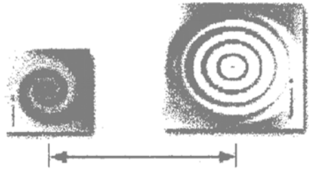
Figura 2.5. Distancia rectilínea entre centroides de dos departamentos (tomada de Martínez, 2002, p. 26).

problema, recurriendo a la distancia rectilínea entre sus centroides. Se presenta la siguiente figura: