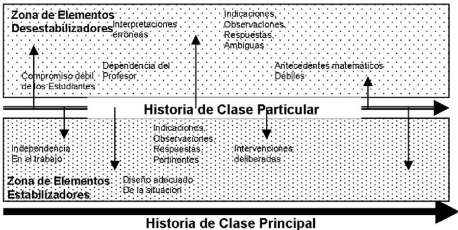
Figura 1. Elementos estabilizadores y desestabilizares que inciden en la cercanía o lejanía de la historia de clase particular con la historia principal.

Para poder asegurar que el efecto didáctico se ha reproducido, la historia particular que desarrolla cada uno de los estudiantes o grupo de estudiantes deberá tener el mayor parecido con la historia principal o ideal. La cercanía o lejanía de la historia principal estará determinada por los elementos estabilizadores o desestabilizadores que se ponen en acción, como ilustra la Figura 1.